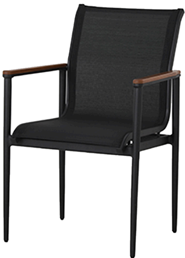
CADEIRA BONI COLEÇÃO CARIBE